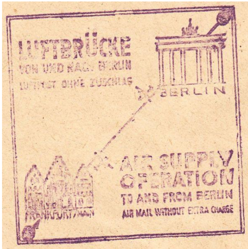
Stempel: Air Supply Operation