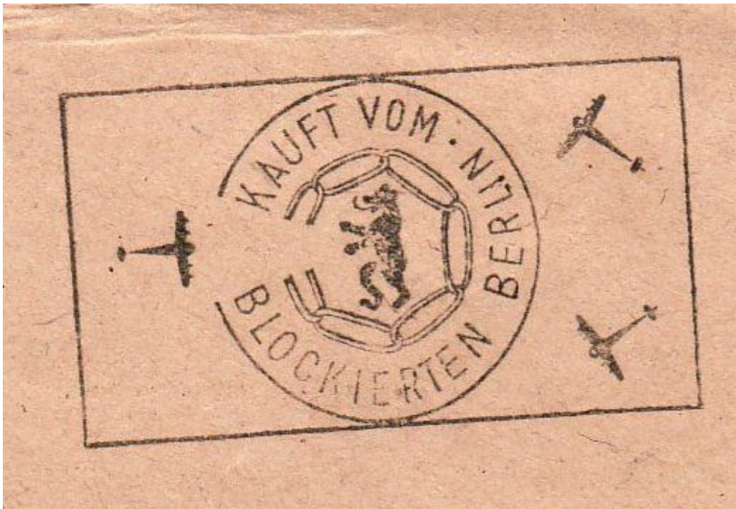
Stempel: Kauft vom blockierten Berlin