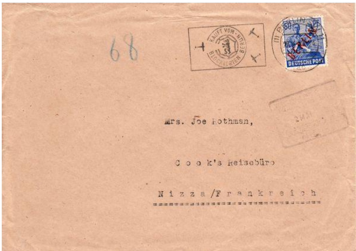
Stempel: Kauft vom blockierten Berlin im Beleg