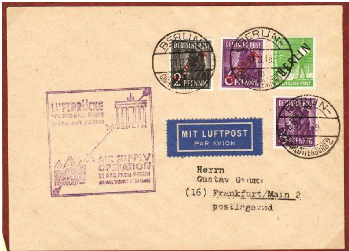
Stempel: Air Supply Operation im Beleg

Das Modul ist dem Philatelisten Werner Zink aus Hechingen, aus dessen Sammlung sämtliche Belege und Stempel stammen, zu großem Dank verpflichtet.