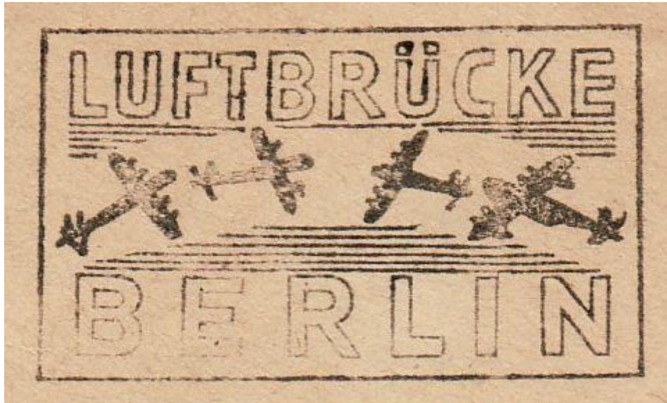
Stempel: Luftbrücke Berlin