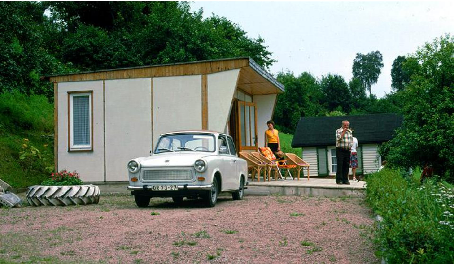
www.geschichte-bw.de Trabant vor einer Datsche (typische Wochenendhaus im Grünen)