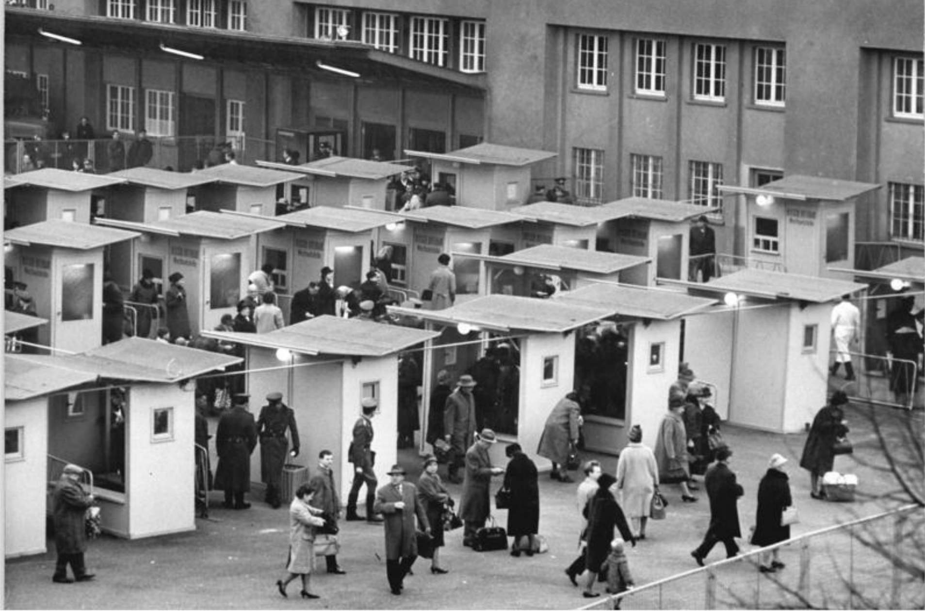
31. Oktober 1964

31.10.1964: Vertrag zum Passierscheinabkommen