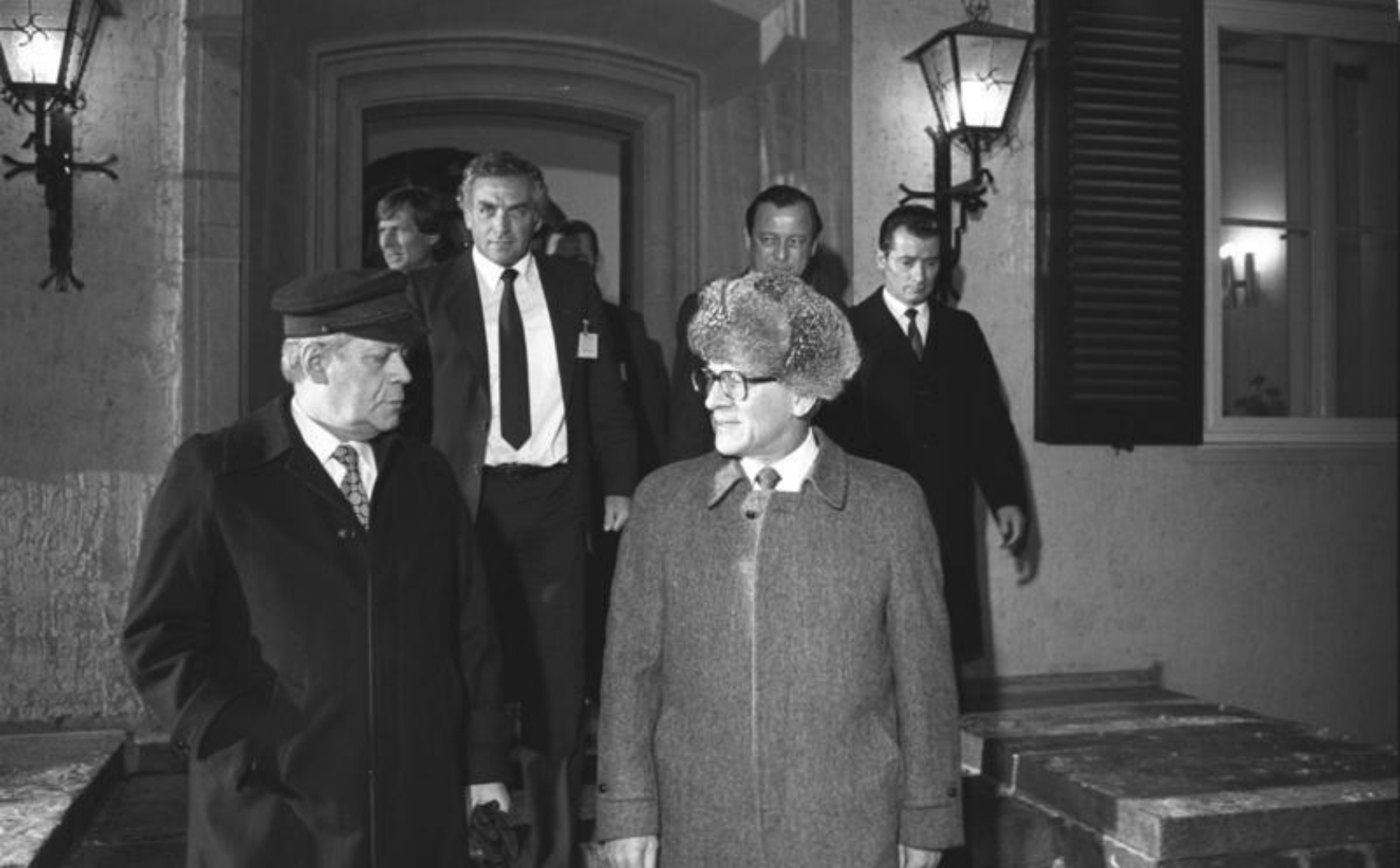
Bundesarchiv, Bild 183-Z1212-049 Foto: Mittelstädt, Rainer | 12. Dezember 1981

12.12.81: Das Gespräch Erich Honeckers, Generalsekretär des ZK der SED und Vorsitzender des Staatsrates der DDR, mit dem BRD-Bundeskanzler Helmut Schmidt ging nach 2 ½ Stunden Dauer zu Ende. Honecker verabschiedete seinen Gast vor dem Gästehaus des Staatsrates am Döllnsee.