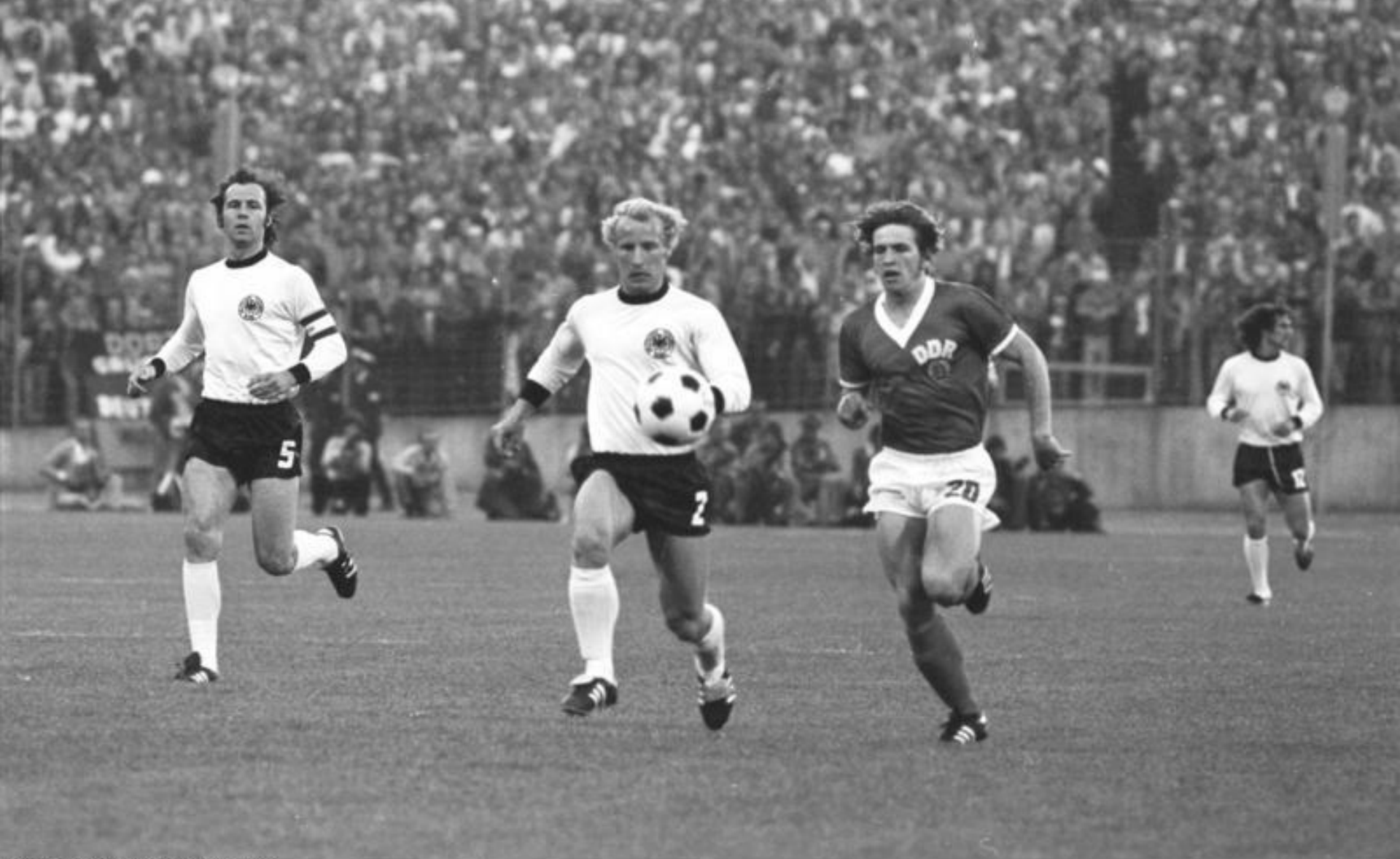
22. Juni 1974

X. Fußball-Weltmeisterschaft/1. Finalrunde, Gruppe 1: DDR - BRD 1:0/DDR-Stürmer Martin Hoffmann (rechts) und Verteidiger Berti Vogts (Mitte) stürmen dem Ball nach. Links Franz Beckenbauer (beide BRD).