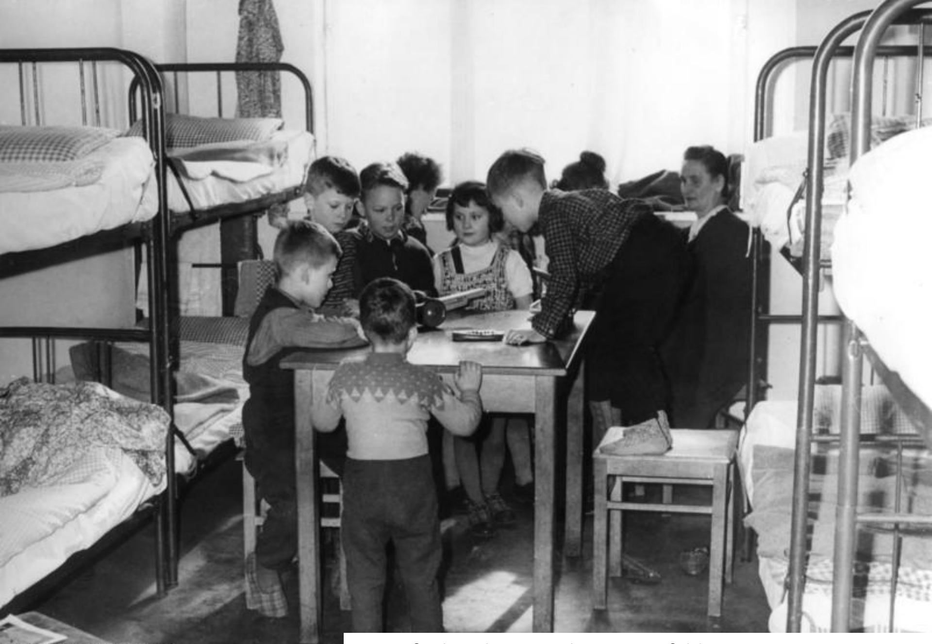
Bundesarchiv, B 145 Bild-P059016 Foto: o. Ang. | 1961 ca.

Notaufnahmелager Berlin-Marienfelde: www.geschichte-bw.de Von 1953-61 die Anlaufstation für Flüchtende aus der DDR