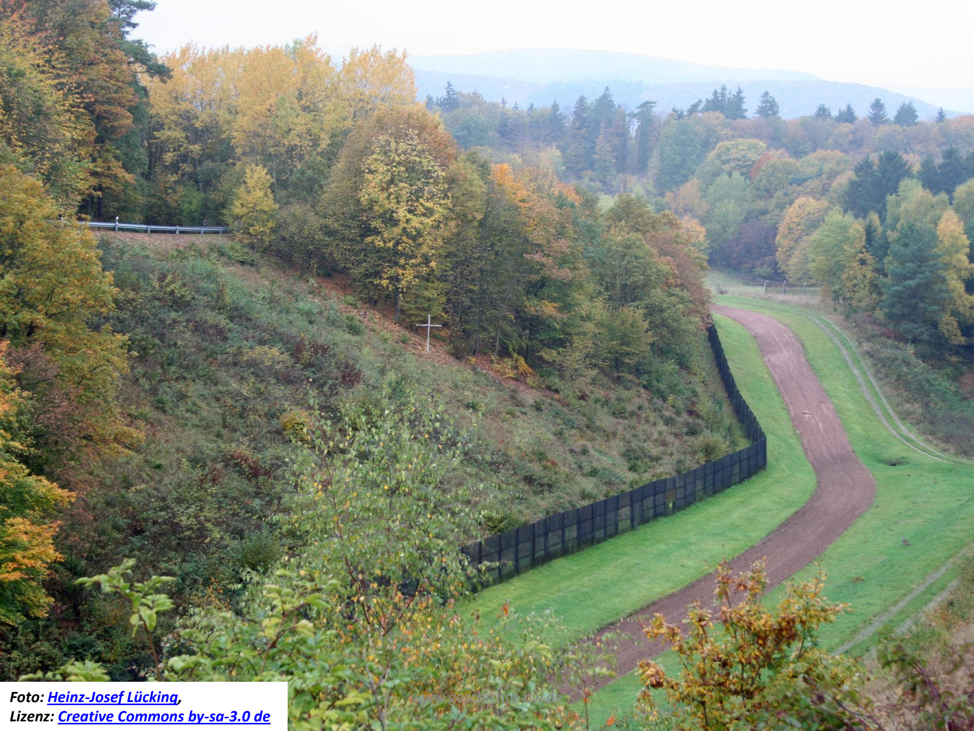
Foto: Heinz-Josef Lücking , Lizenz: Creative Commons by-sa-3.0 de