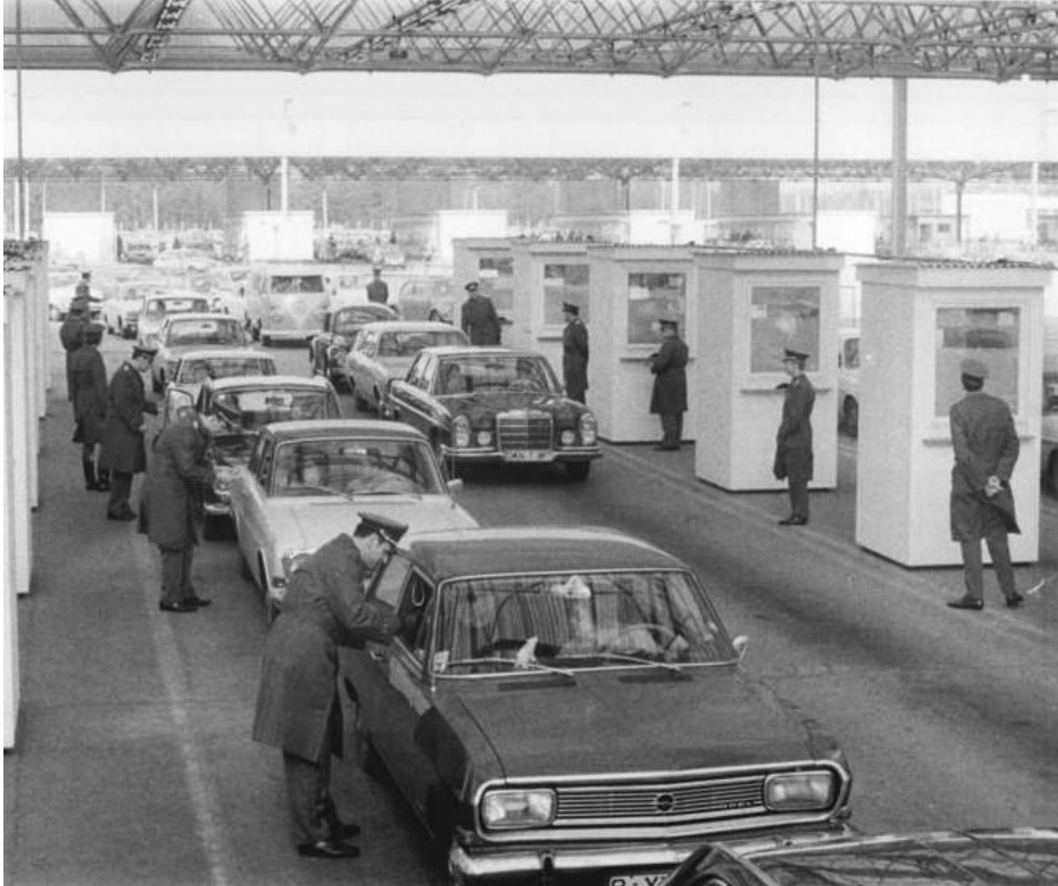
31.3.1972: Grenzübergangsstelle Drewitz bei Potsdam die Abfertigung der Transitreisenden und der in die Südbezirke der DDR reisenden Westberliner Bürger