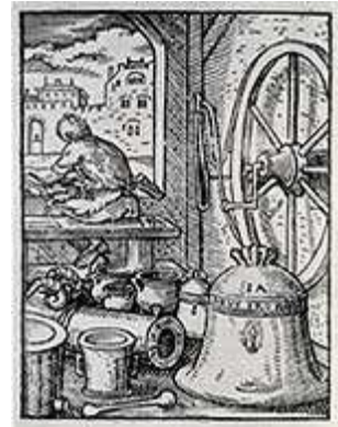
Der Glockengießer (Holzschnitt)

Die 1200 Jahre Glockengeschichte, die im Glockenmuseum Stiftskirche Herrenberg dargestellt sind, beschreiben den langen Weg der Glocke von der lärmenden Signalgeberin zur musikalischen Botschafterin der Kirche. Ausschlaggebend für diesen Wandlungsprozess ist die Fortentwicklung der so genannten Glockenrippe, also der Formgebung und Profilgestaltung der Glocken.