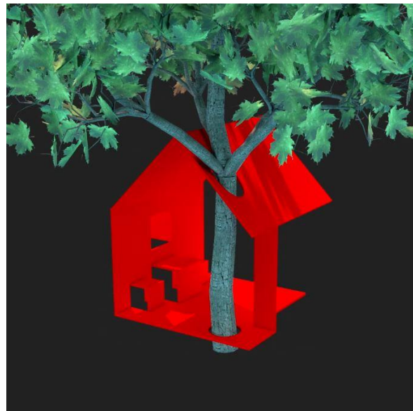
Film-Stills aus der Video-Präsentation eines Schülers des FSG-Fellbach