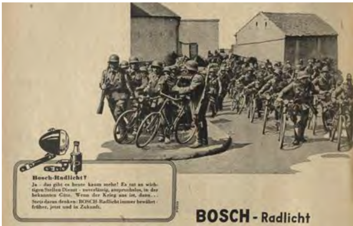
Anzeige in der FKZ 15/1941, S. 18