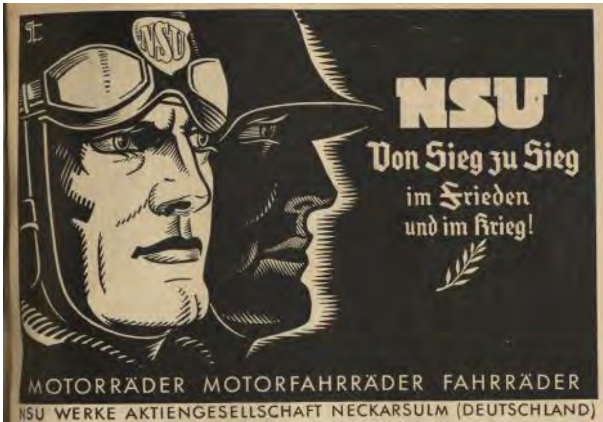
Anzeige in der FKZ 11/1941, S. 3