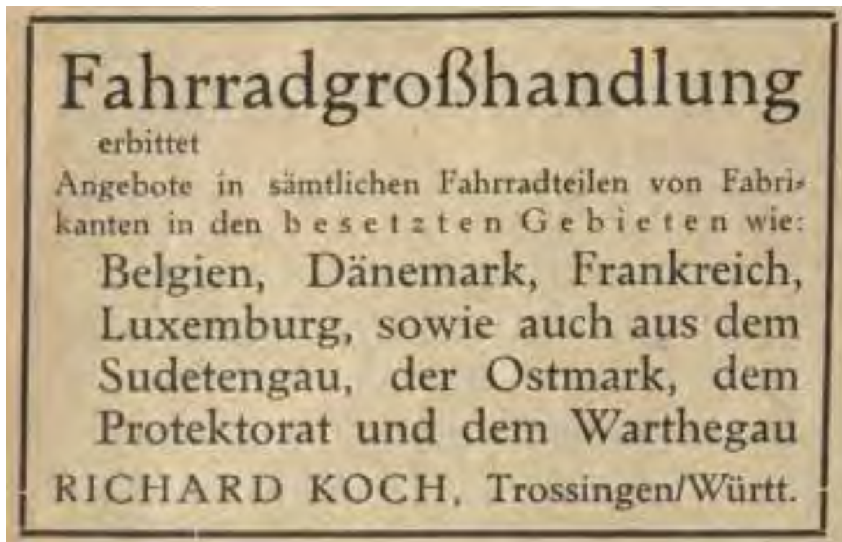
Anzeige in der FKZ 13/1941, S. 8.

militärischen zu folgen, indem er seine Grossisten-Tätigkeit auf die neu eroberten Gebiete ausdehnte und dort um Geschäftskunden warb. 14