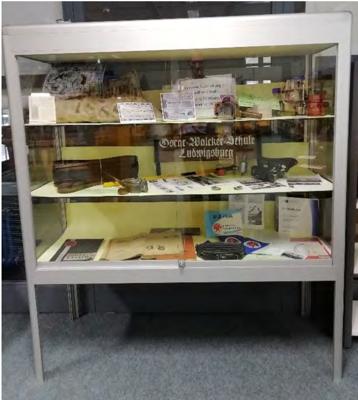
Beispiel für eine Vorschau-Vitrine, hier „Appetizer“ für eine größere Ausstellung mit dem Stadtarchiv Backnang 2020 (Standort: Schulbibliothek)

Aber: Wie mache ich eine gute Ausstellung?