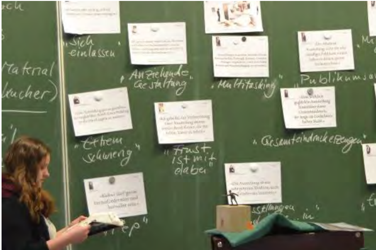
Schüler im TG „übersetzen“ Ausstellungssprüche von Experten

Am Beispiel der Firmenhistorie Hahn/Backnang mit Schwerpunkt auf den 30-er Jahren soll hier ein Vorschlag gemacht werden, wie dieser Inhalt exemplarisch in eine kleine Ausstellung/ ein kleines Projekt umgesetzt werden kann. Die jeweiligen Objekte (z. B. digitaler Bilderrahmen, alter Koffer, alter themenspezifischer Gegenstand, Zeitungsstock etc.) sind in der Regel leicht zu organisieren. Man kann auch Kompromisse zu schließen, z. B. statt eines digitalen Bilderrahmens mit Laptops oder Bildschirmen arbeiten.