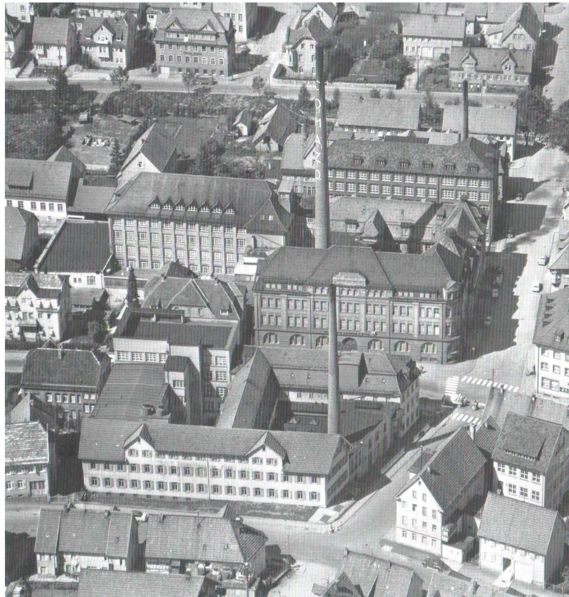
Tailfingen, Zentrum 1958