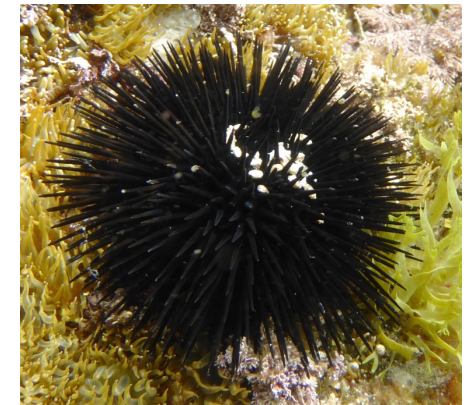
Abb. 2: Seeigel mit Verdauungsresten zwischen den Stacheln auf der Aboralseite.

Der Kieferapparat der Seeigel besitzt einen komplexen fünfstrahligen Aufbau. Dabei werden fünf bewegliche Zähne von bis zu 30 kalkigen Skelettplatten durch Muskeln und Sehnen zusammengehalten und bewegt. Bei größeren Arten wachsen die Zähne im Laufe einer Woche bis zu einem Millimeter. Die Zahninnen- und -außenseite sind unterschiedlich hart. Die Innenseite ist weicher als die Außenseite. Diese Konvergenz zu den Zähnen bei Nagetieren hält sie durch die Abnutzung immer scharf. Einige Arten können sich damit sogar ins Gestein eingraben. Im Zentrum des Kauapparates befindet sich der Schlund, der direkt zum Magendarmtrakt führt. Die Afteröffnung befindet sich auf der Aboralseite. Hier kann man oft noch die Verdauungsreste zwischen den Stacheln sehen (s. Abb. 2).