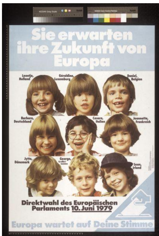
Die Zukunft Europas - aus der Perspektive von 1979, Teil 2