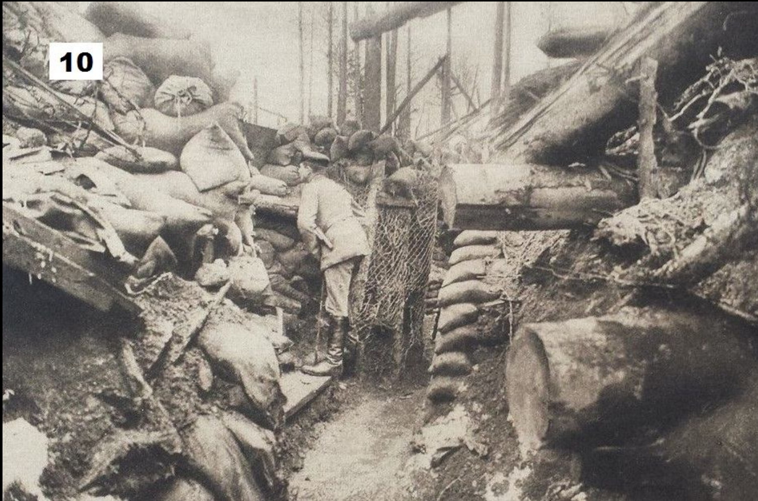
(undatiertes Pressefoto: "In einem Schützengraben in den Vogesen, drei Meter vom Feinde. Bei dem kleinen Holzrahmen, der oberhalb des officers sichtbar ist, liegt der Gegner.")