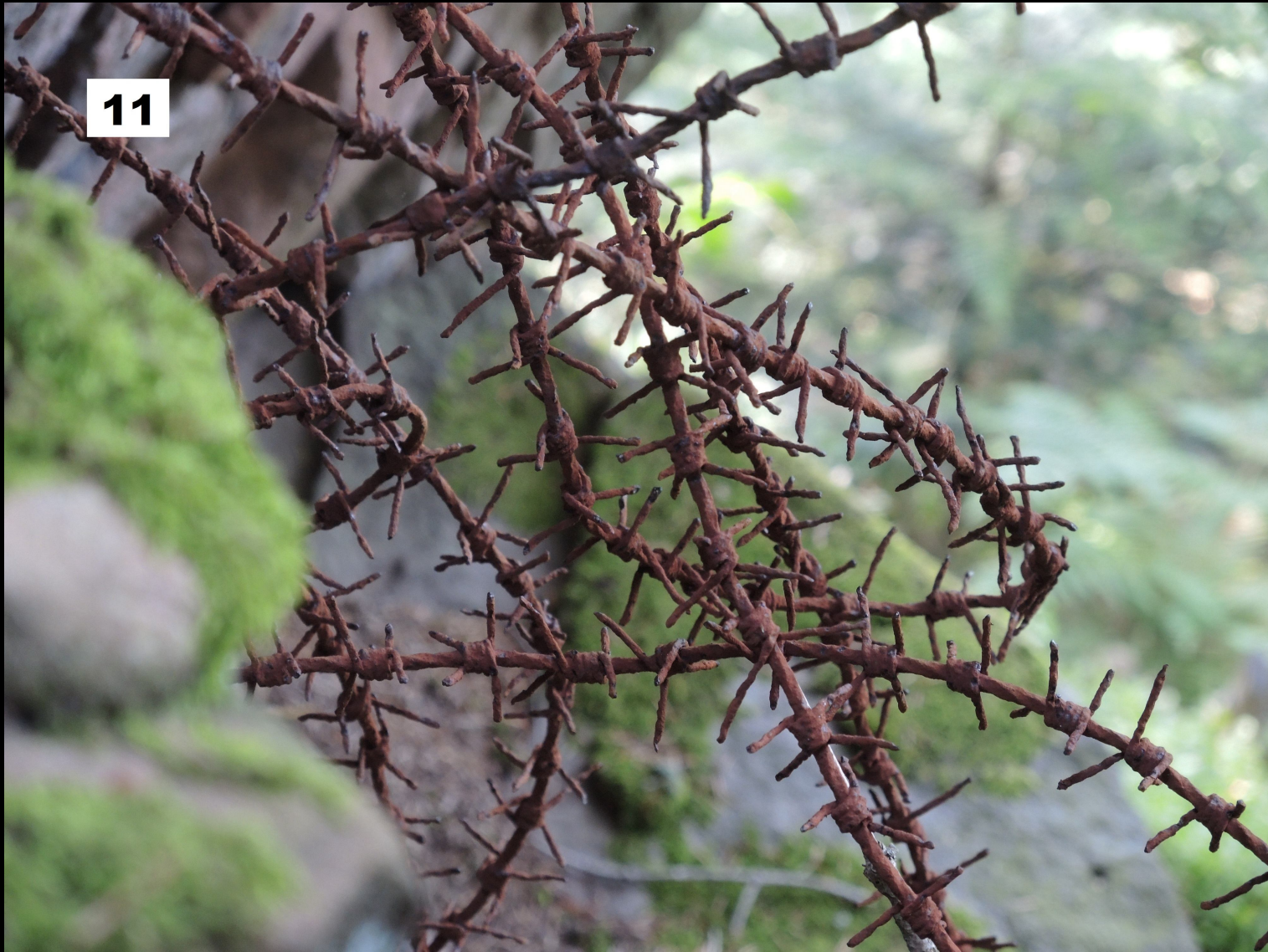
© Rainer Sammet (Vogesen, Pain de Sucre, 2013)