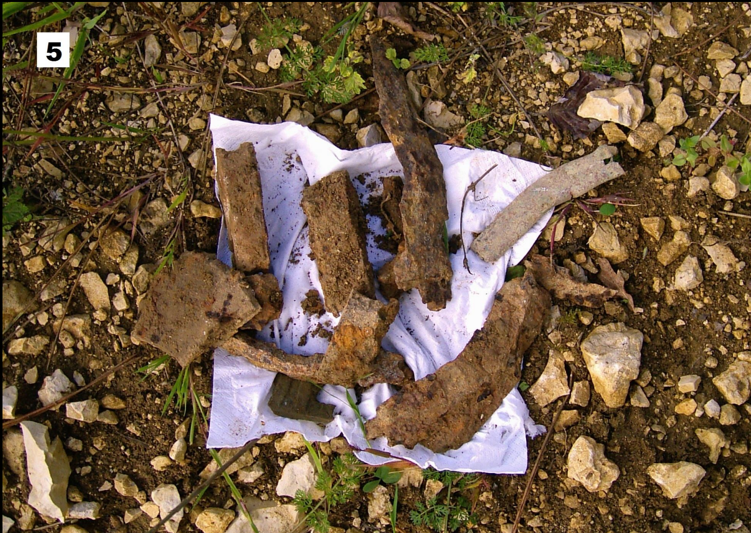
© Rainer Sammet (Verdun 2006, Bois de Vaux Chapitre)