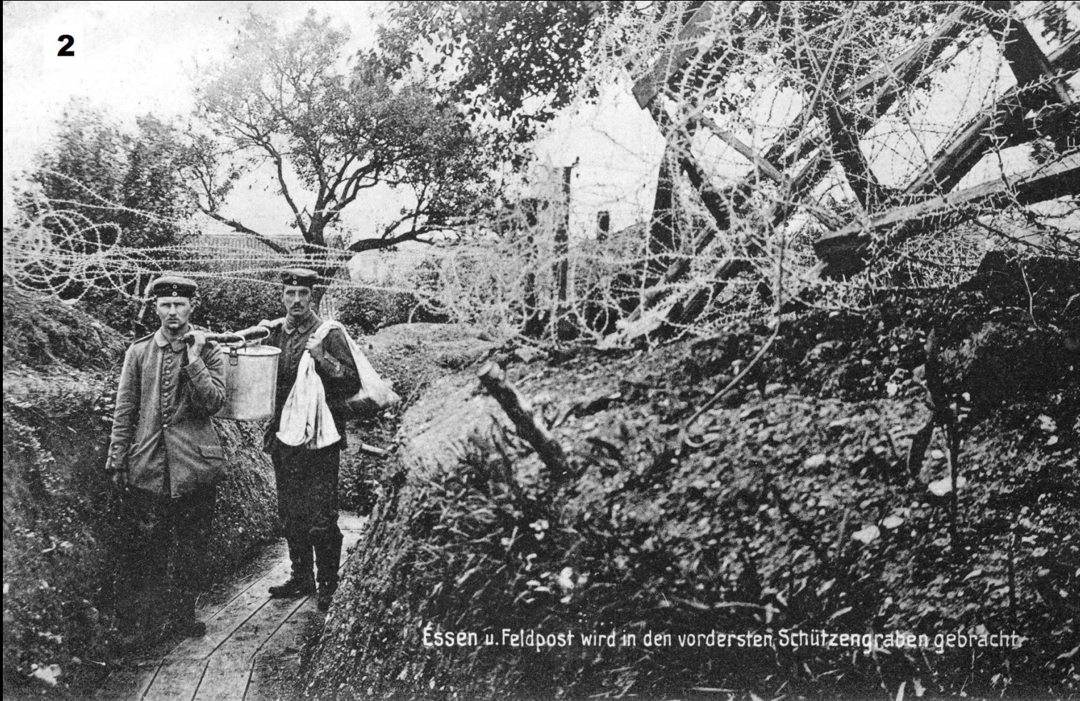
Essen u. Feldpost wird in den vordersten Schützengraben gebracht.