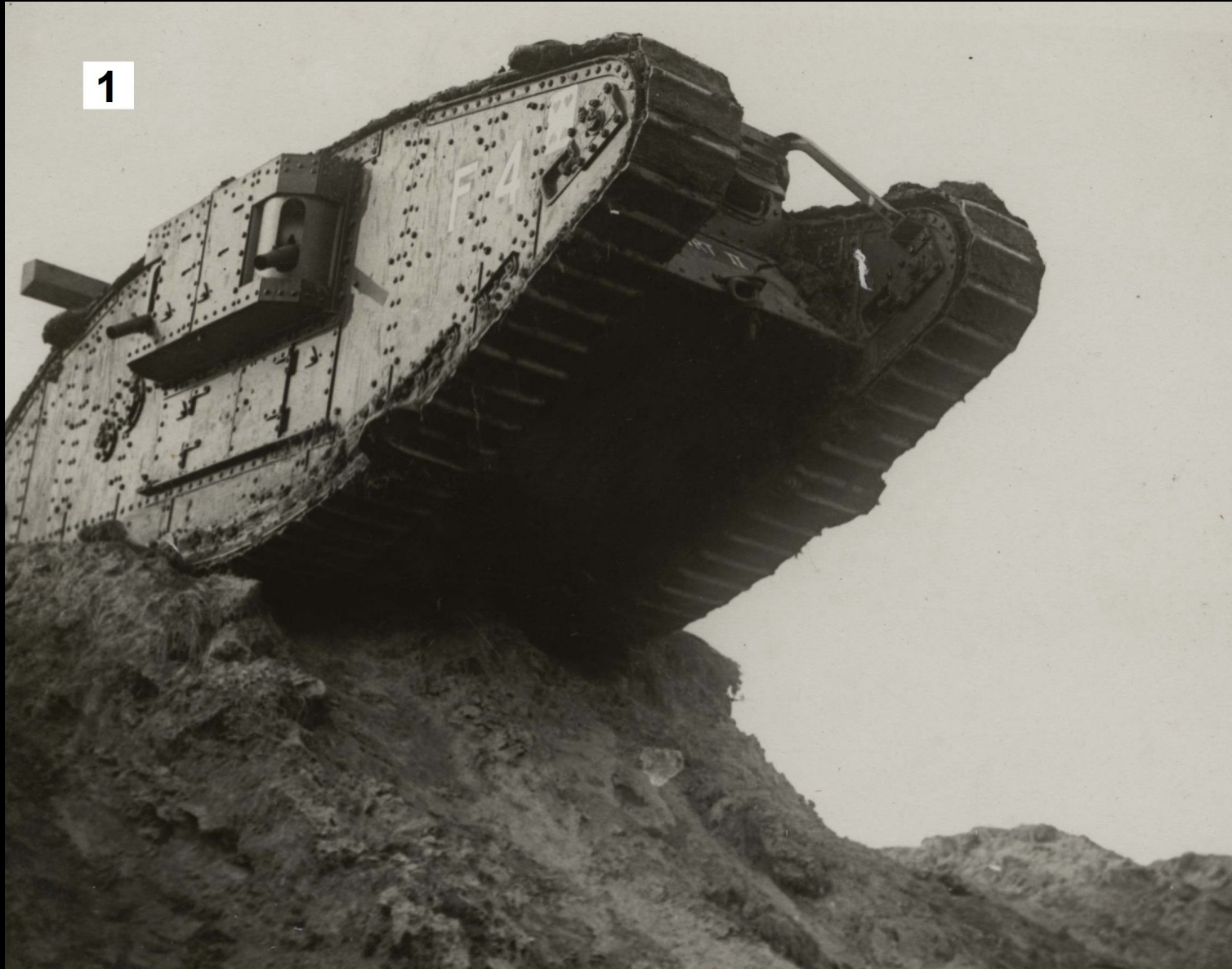
Wailly 21.10.17 Tank britannique avant l'offensive sur Cambrai").