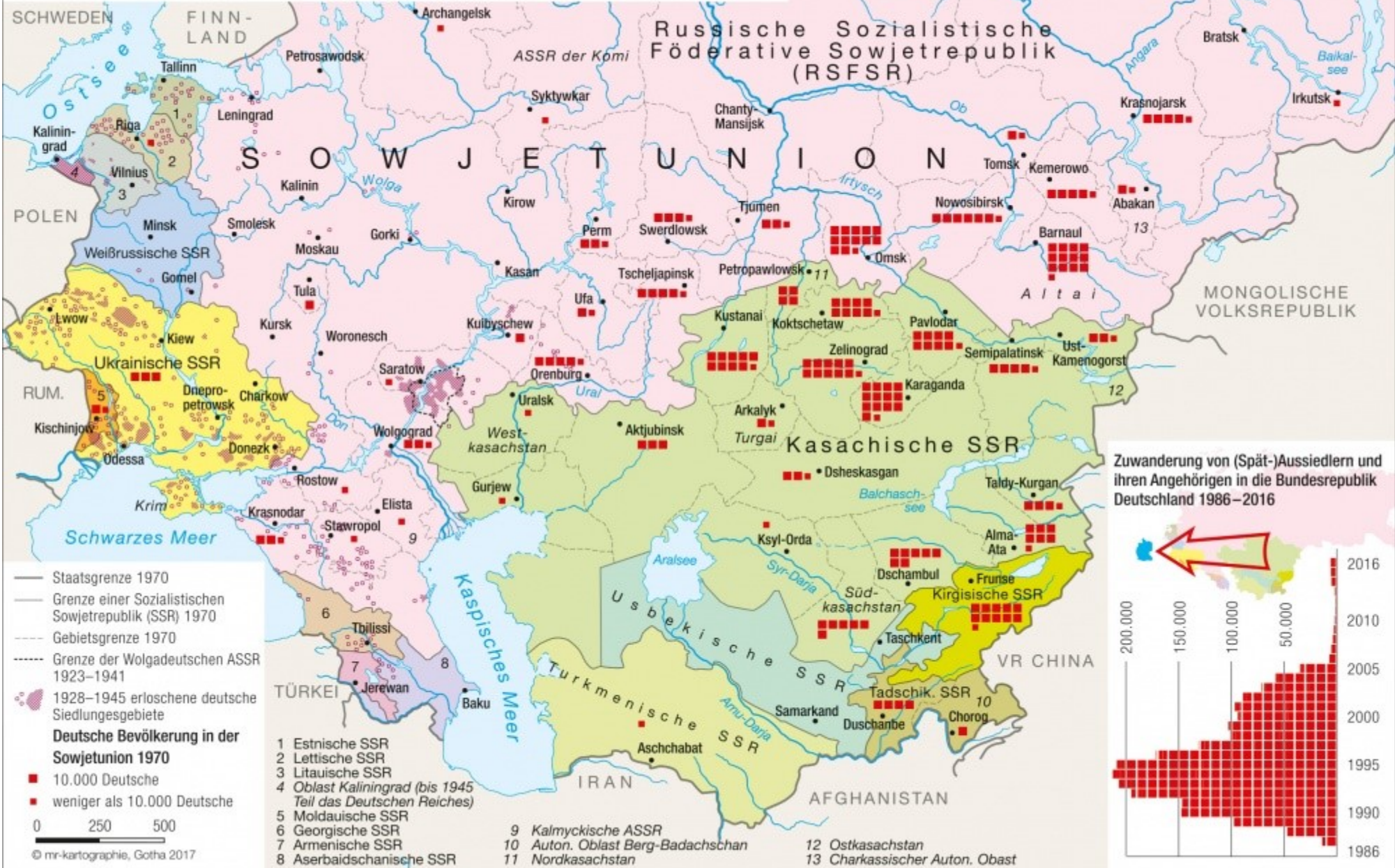
Zuwanderung von (Spät-)Aussiedlern und ihren Angehörigen in die Bundesrepublik Deutschland 1986-2016