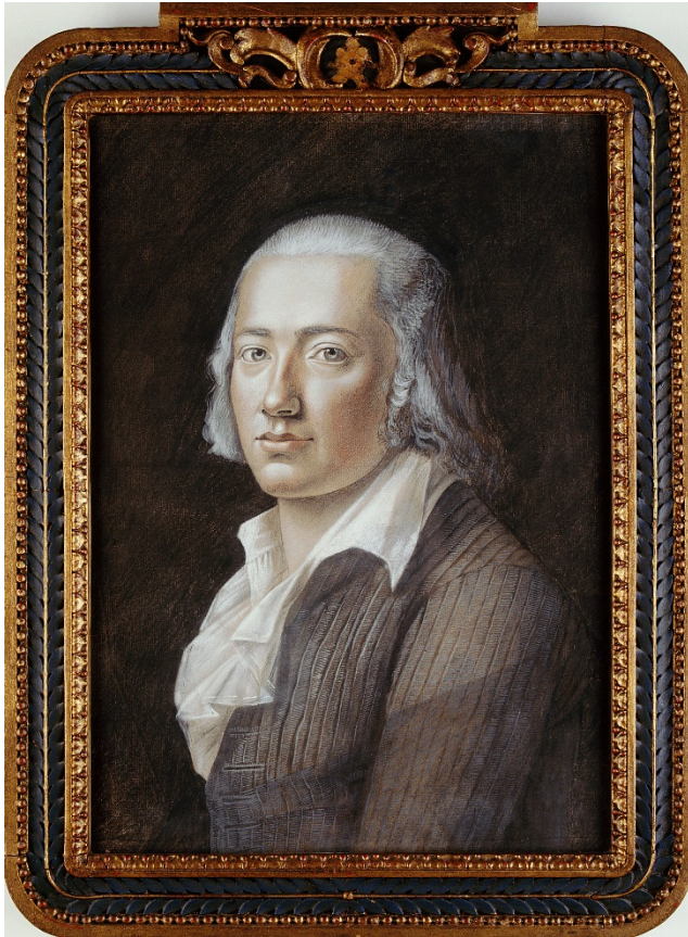
Friedrich Hölderlin. Pastell von Franz Hiemer (1792).