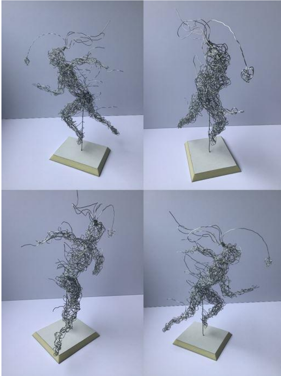
Abbildung 2