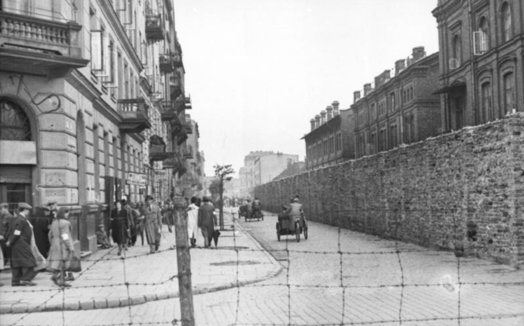
Juni 1942