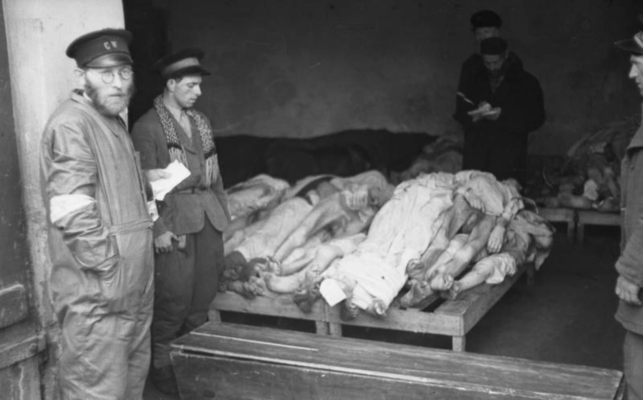
25. Mai 1941 https://upload.wikimedia.org/wikipedia/commons/e/e3/Leist_Zarz%C4%85dzenie_dotycz%C4%85ce_dzielnicy_mieszkalnej_%C5%BByd%C3%B3w_1940.jpg, public domain