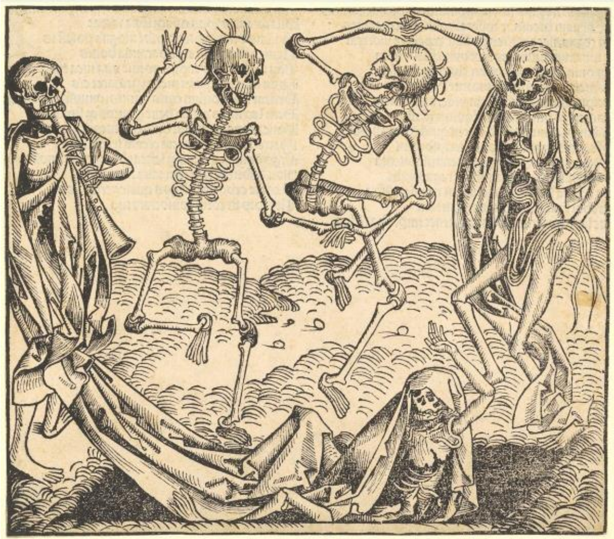
Auferstehung der Toten (Totentanz), Holzschnitt von Michael Wolgemut in Hartmann Schedels Weltchronik von 1493

Der Totentanz ist ein traditionelles Bildthema, das bis heute in der Gegenwartskunst präsent ist. Der Totentanz taucht als Bildform im Spätmittelalter auf und verbreitete sich in der Folge in ganz Europa. Oft tanzen Skelette Hand in Hand mit Menschen aller gesellschaftlicher Schichten (Päpste, Könige, Soldaten, Händler, Handwerker, Bauern und Mägde). Die Botschaft lautet: Alle Menschen, egal ob im Leben König oder Bauer sind vom Tod gleichermaßen betroffen.